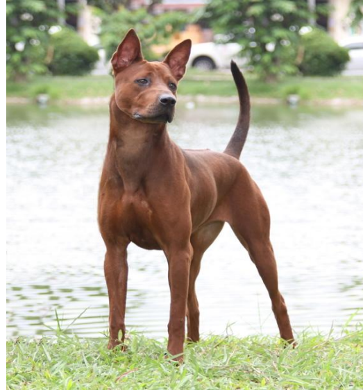
สุนัขพันธุ์ไทยหลังอาน

http://www.marketdogs.com/index.php?topic=1708.0