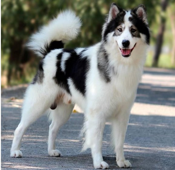
สุนัขพันธุ์ไทยบางแก้ว

สุนัขพันธุ์ทาง หมายถึง สุนัขพันธุ์ผสมหรือสุนัขจรจัดทั่วไป ซึ่งไม่มีลักษณะเด่นของสุนัขพันธุ์ต่างประเทศทุกสายพันธุ์อย่างชัดเจน หรือเป็นสุนัขที่ไม่สามารถระบุได้ว่าเป็นพันธุ์ใด